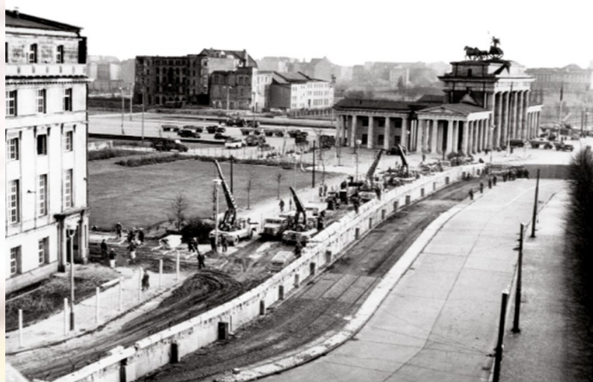
Le 13 août 1961, Berlin-Est est bouclée : des sentinelles surveillent la frontière et des barbelés sont installés. La ville est coupée en deux. Dans les semaines suivantes, le mur est érigé et un no man's land est créé (fossé anti-véhicules, miradors, mines).