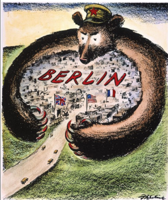
Caricature américaine, Dick Spencer, 1948. En juin 1948, les Soviétiques bloquent tout accès terrestre à Berlin-Ouest. Les Américains mettent en place un pont aérien pour ravitailler les deux millions et demi de Berlinois de l'Ouest.

1 D'après les doc. 1 et 2, décrivez le blocus de Berlin.